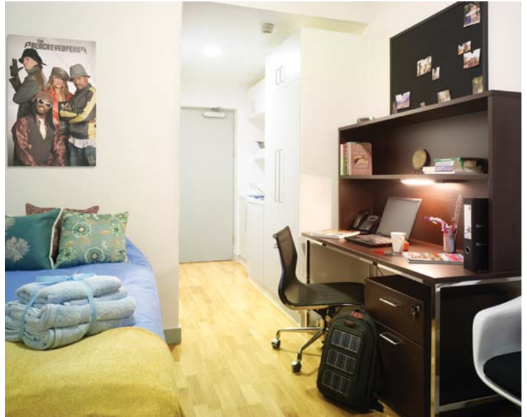
写真はNidoキングスクロス学生寮 (Hall of Residence)

パート 2の過程でも、宿泊設備にホームステイを選ぶ学生もいます。引き続きホームステイを希望される場合は、パート 1のコース中に当事務局とホスト側に滞在延長の希望を出して下さい。